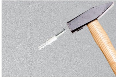
Step 2: Use a hammer to drive the expansion screw into the hole position