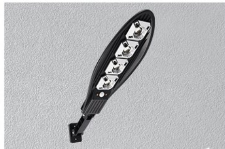
Step 4: Align the product mounting bracket with the hole position and tighten the screws