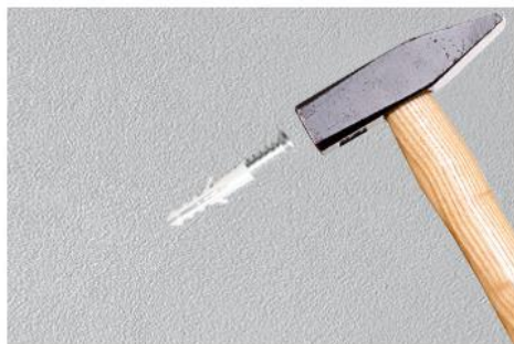
Step 2: Use a hammer to drive the expansion screw into the hole position