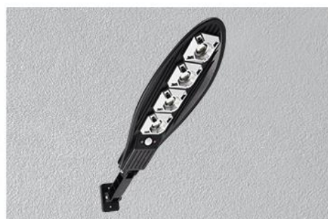
Step 4: Align the product mounting bracket with the hole position and tighten the screws