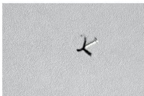
Step 3: Screw out the screws